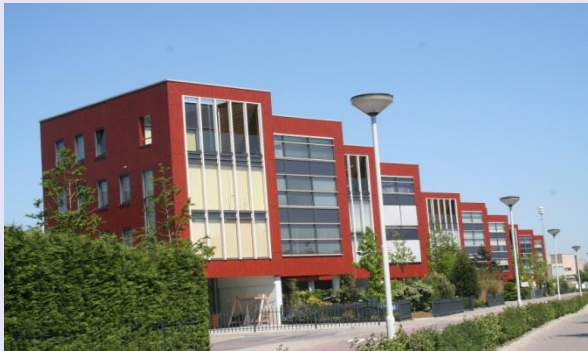
Project “Portland” te Albrandswaard: 16 woningen