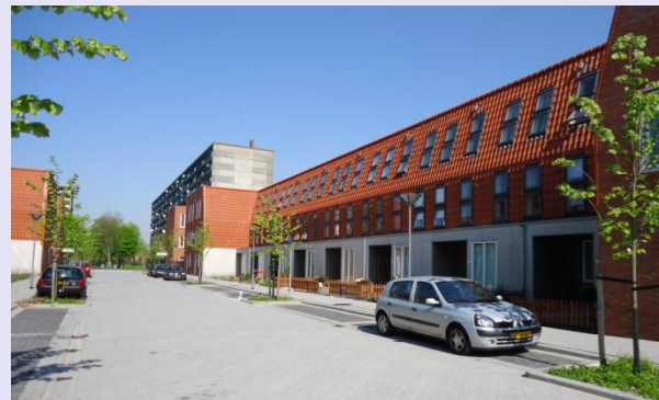
Project “Buurtwachters” te Maassluis: 80 woningen