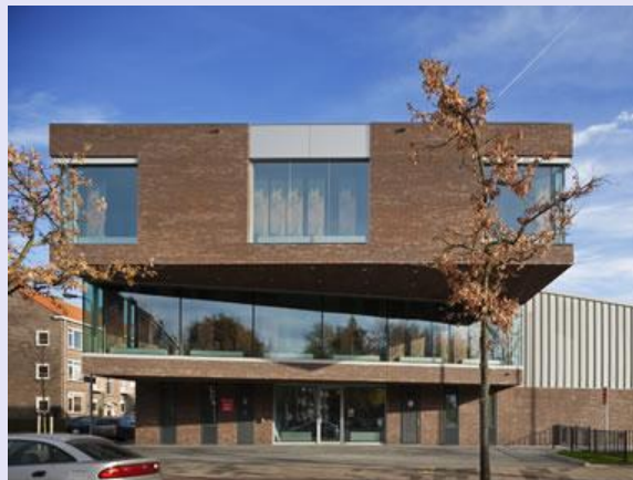
Project nieuwbouw Brandweerkazerne te Rijswijk: