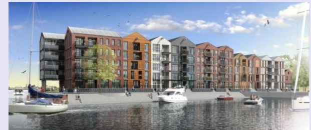
Krimpen aan den IJssel