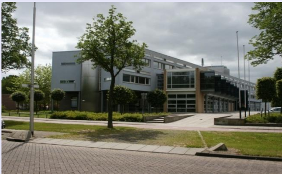
Project nieuwbouw Gemeentehuis Oud-Beijerland: